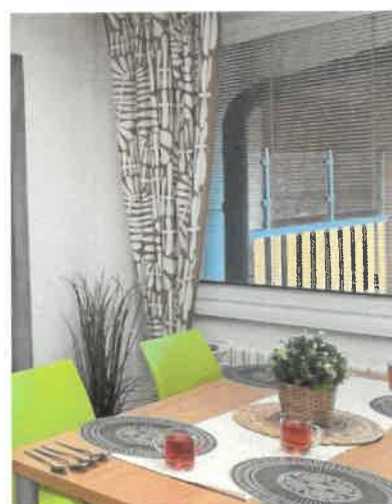
Jídelny na oddělení