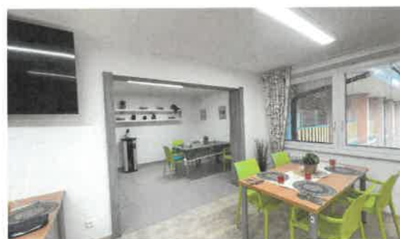
Společná jídelna na 2. oddělení